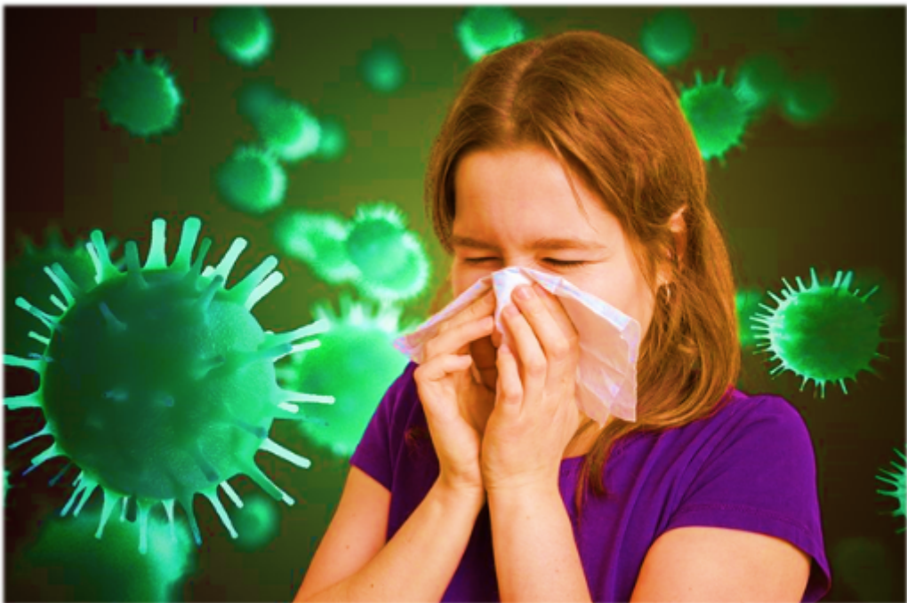
Как не заразиться